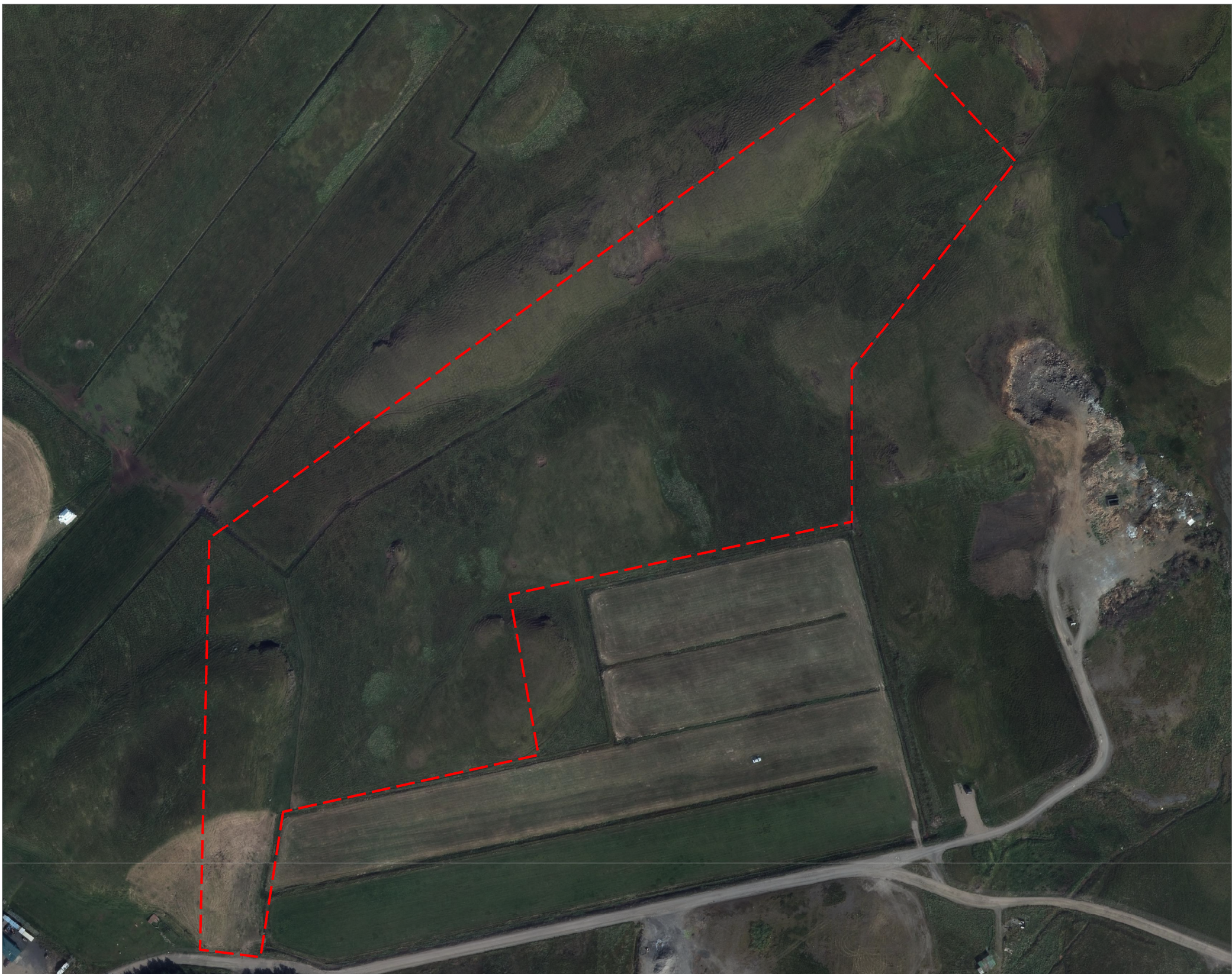
Lofmynd af skipulagssvæðinu