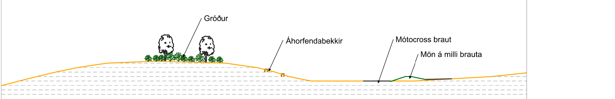
Sneiðing A-A' Skýringarmynd - núverandi höll notaður m.a. fyrir áhorfendur með bekkjum