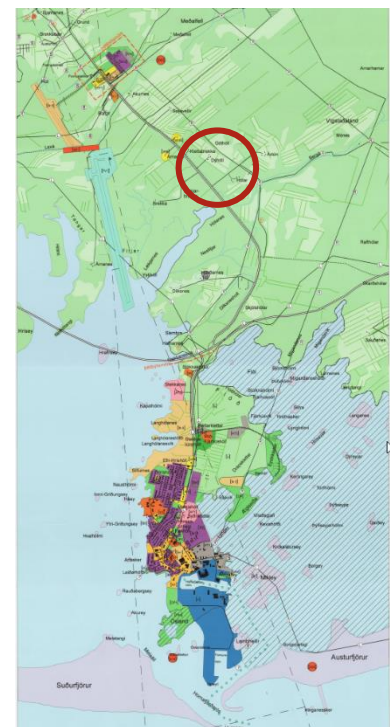
MYND 2 Gildandi aðalskipulag Hornafjarðar. Svæðið sem breytingum tekur er innan rauða hringsins.

Sveitarfélagið stefnir að því að auka ferðaþjónustu í sveitum Hornafjarðar og að uppbygging verði í samhengi við staði þar sem hefur verið búseta eða tengist bæjarhlöðum og myndi eftir atvikum samfellu með byggð sem þegar stendur og sé víkjandi í landslagi. Uppbygging skal falla að byggðarmynstri og að vandað sé til mannvirkja með tilliti til útlits, varanleika og viðahalds. Hún skal