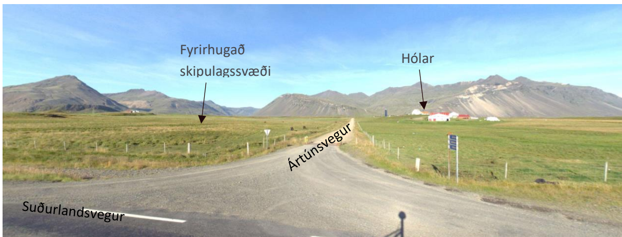
MYND 1 Horft inn á svæðið frá Suðurlandsvegi.

Svæðið fellur ekki í flokk verndarsvæða.