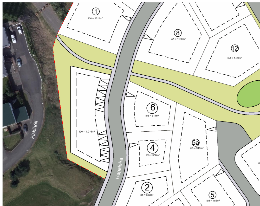
DEILISKIPULAGSBREYTING MKV. 1:1.000