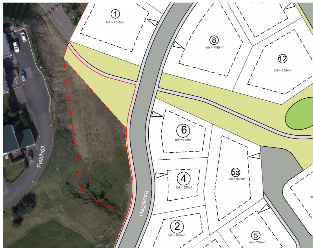
GILDANDI DEILISKIPULAG MKV. 1:1.000