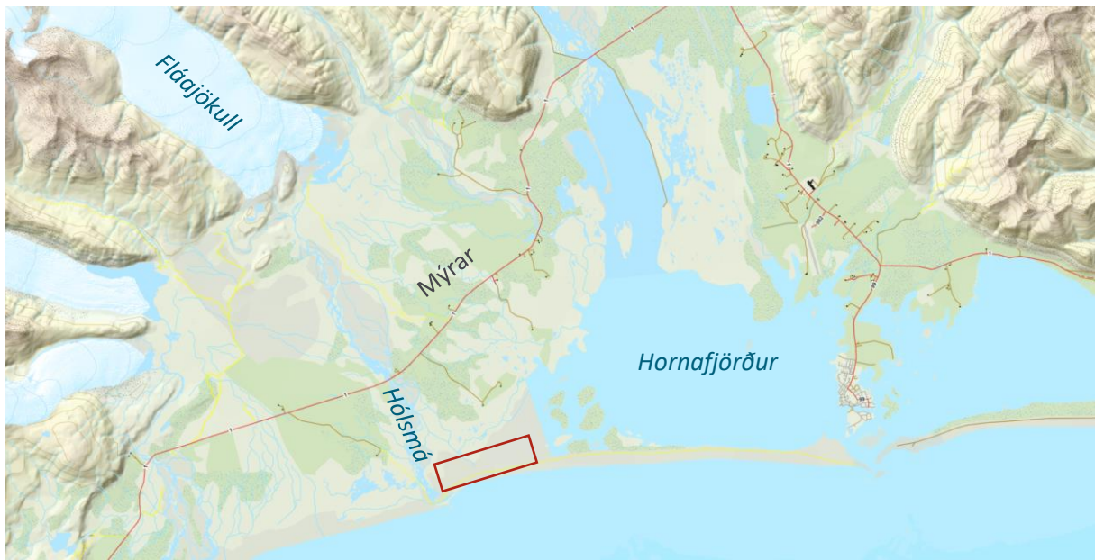
Mynd 1. Yfirlitsmynd yfir fyrirhugað efnistökusvæði. (Grunnkort fengið hjá Landmælingum Íslands)

Svæðið er flatt og ógróið og flokkast sem sandstrandarvist (L7.1) með litlum hluta sem strandmelhólavist (7.3) 1 . Svæðið er á skilgreindu mikilvægu fuglasvæði og við Hestgerðislón sem er talningasvæði sela, er landselur oft á tíðum sjáanlegur en hann er talinn í bráðri hættu 2 .