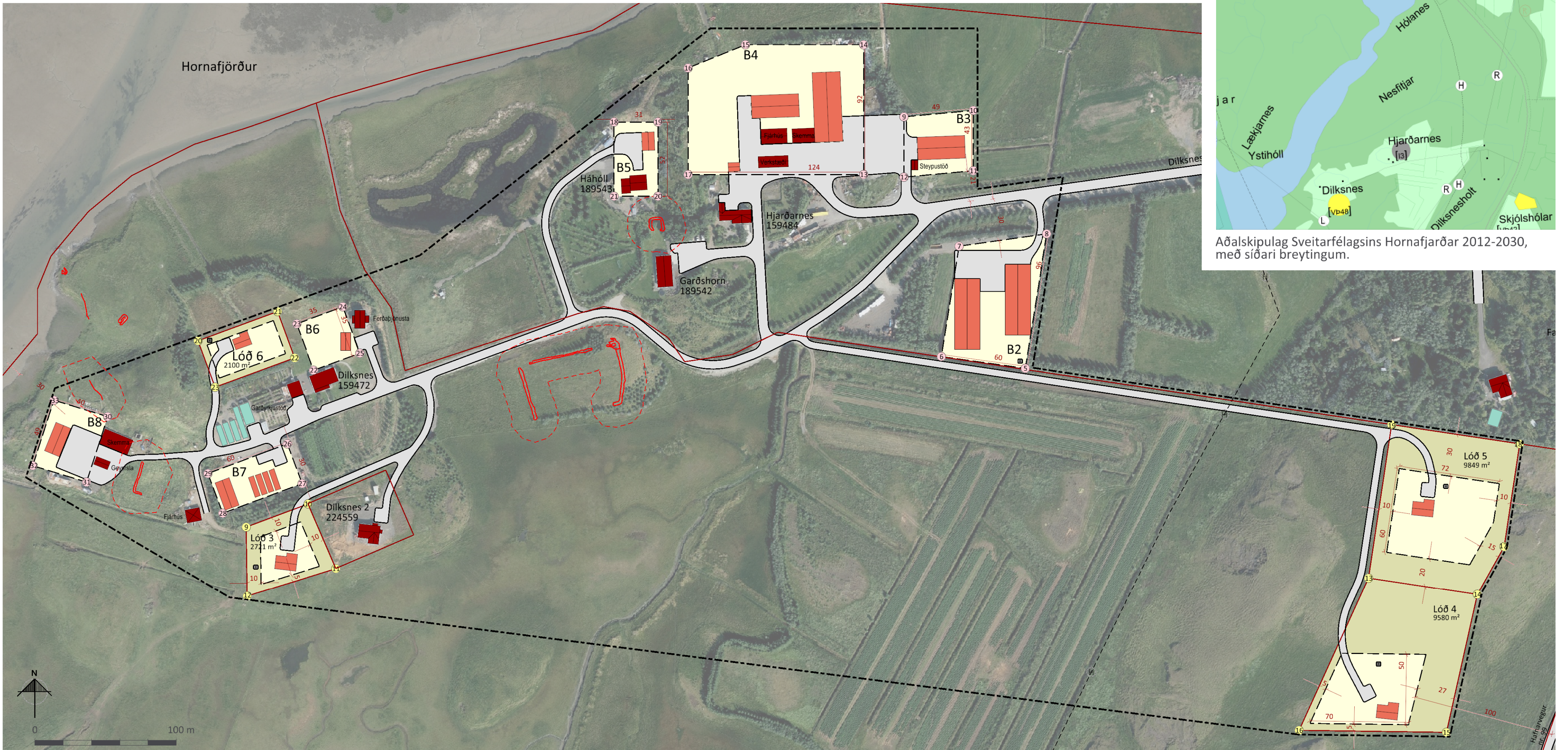
Deiliskipulagsuppráttur í mkv. 1:2.000.