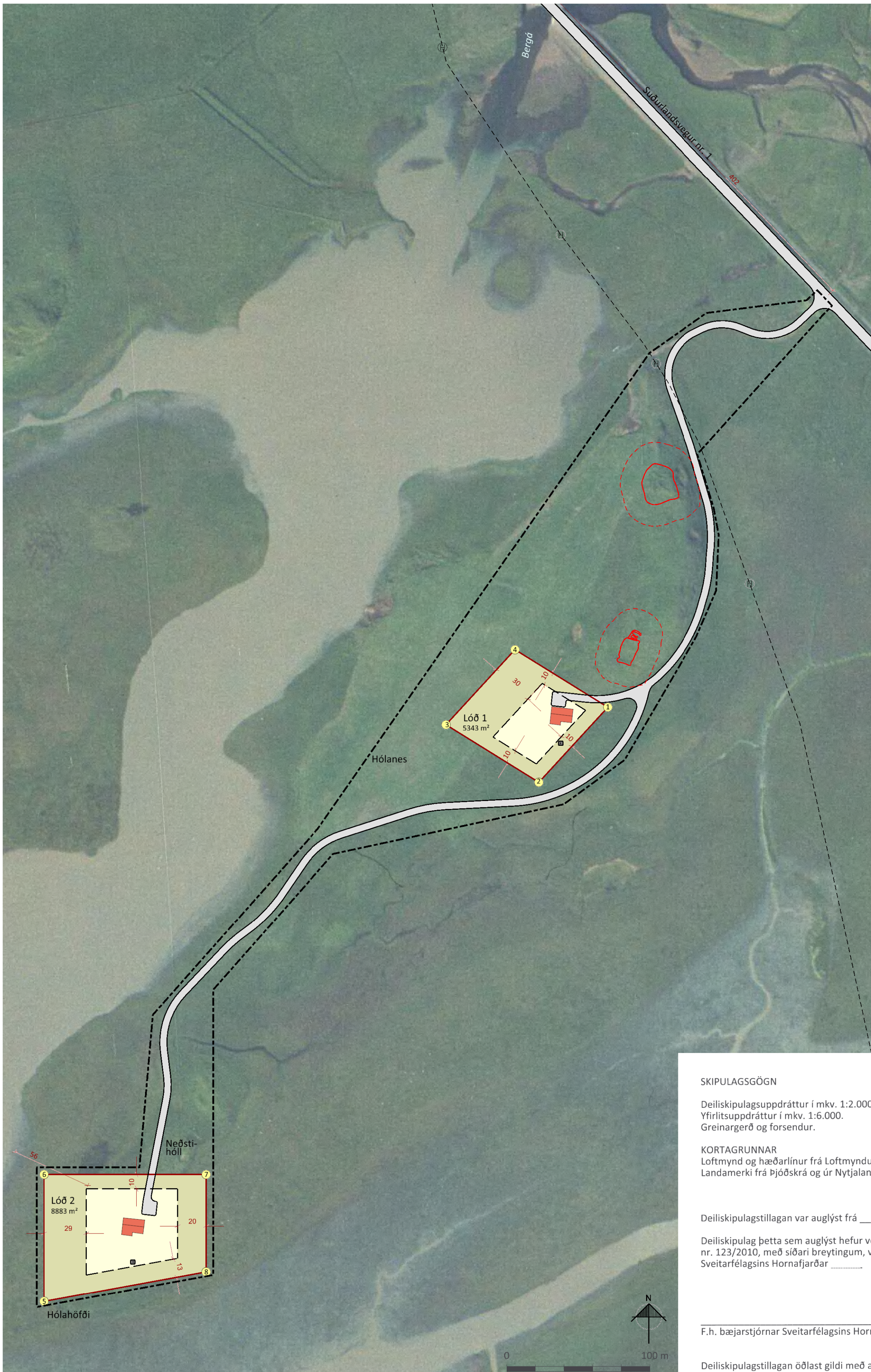
Deiliskipulagsuppráttur í mkv. 1:2.000.