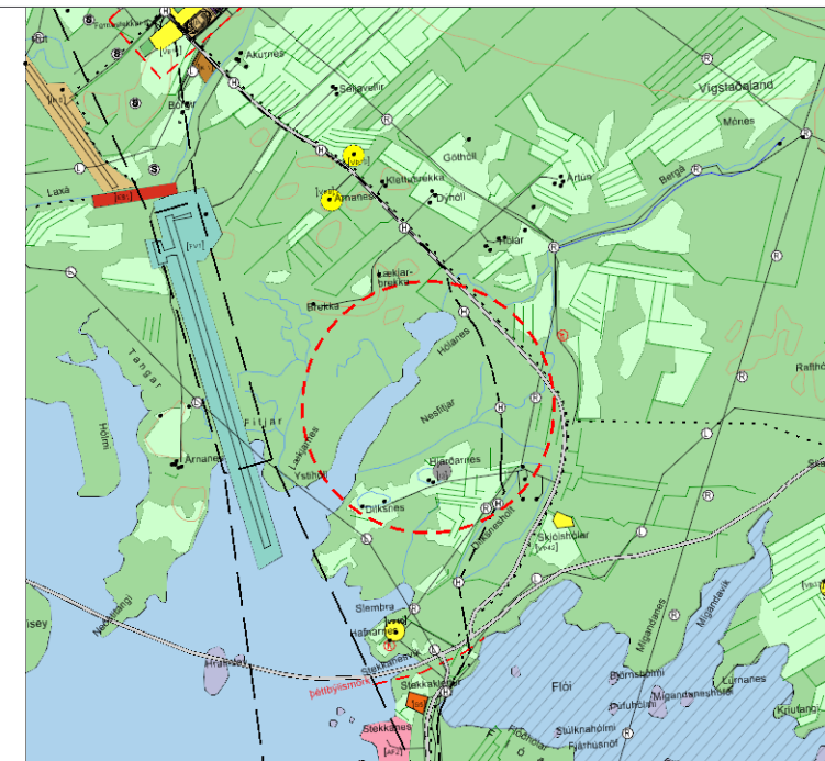
Hluti af gildandi aðalskipulagsuppráttu

Breyting er talin hafa óveruleg umhverfisleg áhrif. Ávallt eru staðbundin áhrif af byggingum en leggja skal áherslu á að í deiliskipulagi sé hönnun mannvirkja vönduð og í samræmi við stefnumið sveitarfélagsins í gildandi aðalskipulagi, kafla 16.3. Á Dilksnesi mun vera byggt nálægt núverandi byggð. Áhrif á fuglalíf eru óveruleg eftir að framkvæmdum lýkur, enda svæðið í núverandi bæjartorfu. Breytingin er talin styðja við stefnu í gildandi aðalskipulagi en þar kemur fram að ferðabjónusta í sveitum Hornafjarðar verði aukin til að skjóta styrkari stöðum undir atvinnulíf og menningu í sveitarfélaginu.