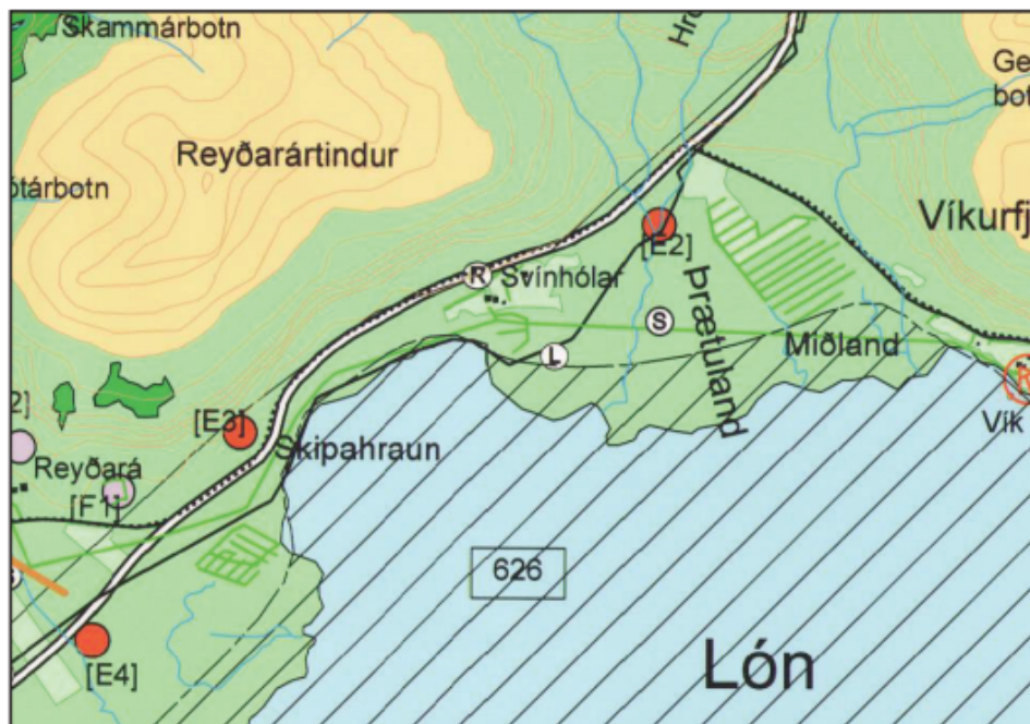
Úr Aðalskipulagi Sveitarfélagsins Hornafjörður 2012-2030 / Nes - Lón