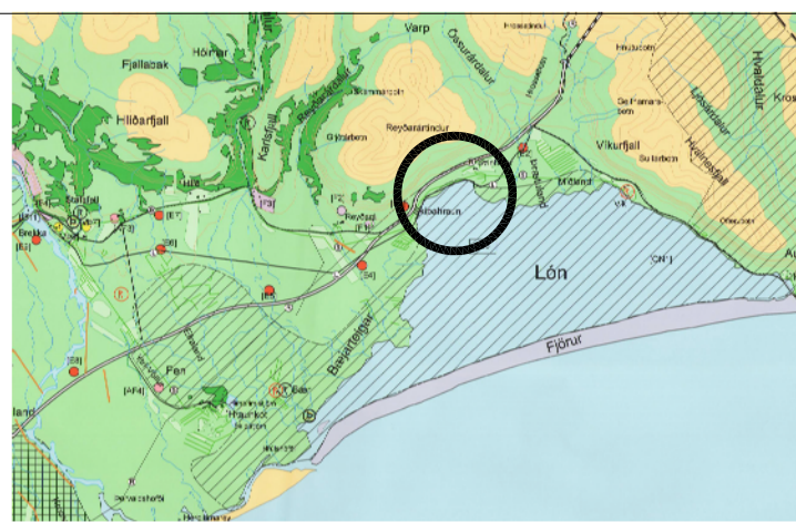
Hluti Aðalskipulags 2012-2030