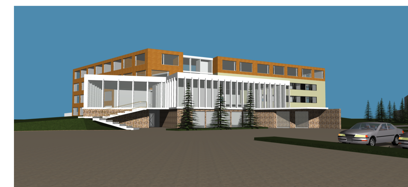
Útlit - Suðvestur