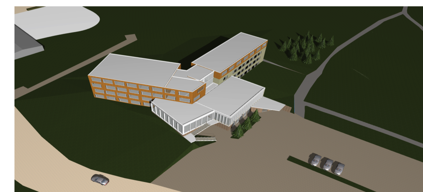
Yfirlitsmynd - Suðvestur