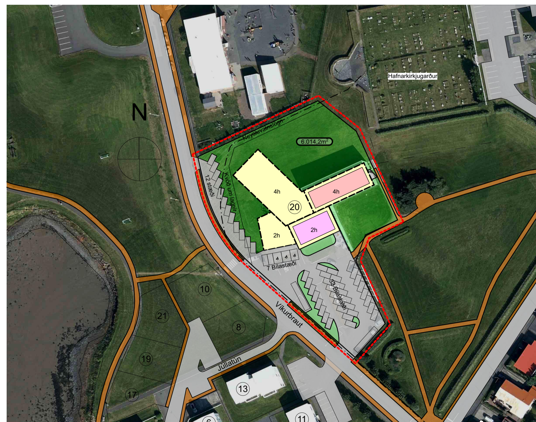
Skýringaruppráttur með nýju deiliskipulagi

(Myndirnar sýna leyfilegt umfang/stækkun hótelsins, en útlit er aðeins hugmynd, til að gefa tillögunni skala).