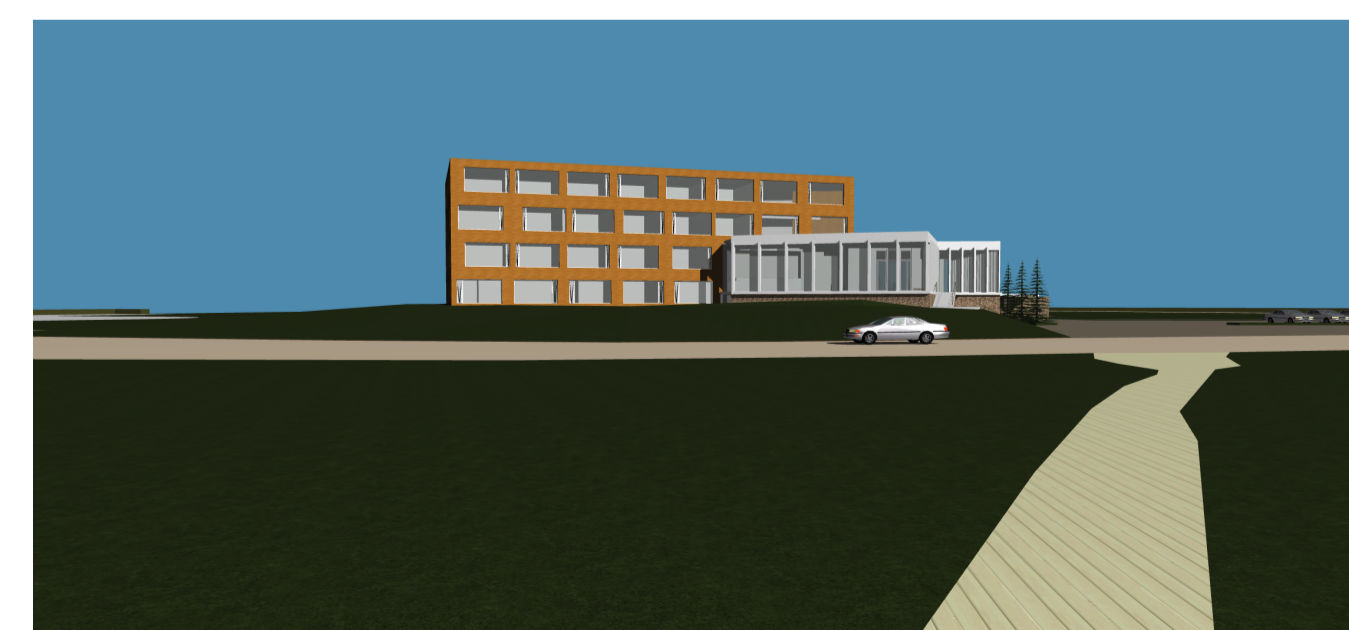
Útlit - Vestur