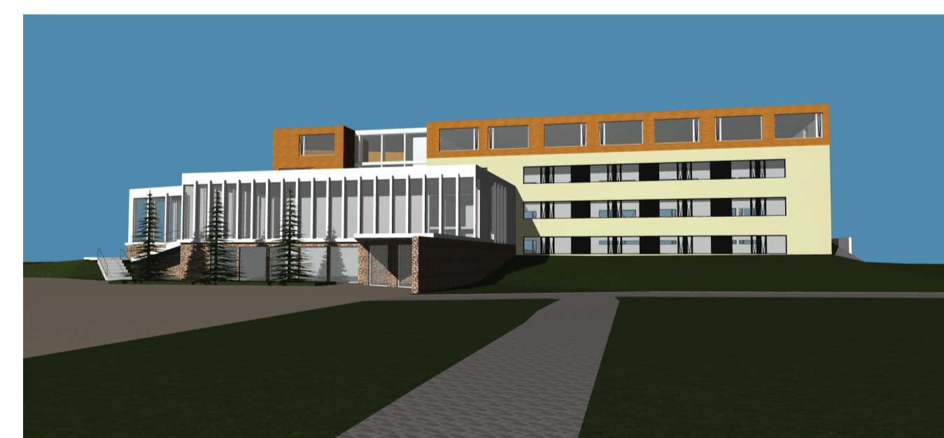
Útlit - Suður