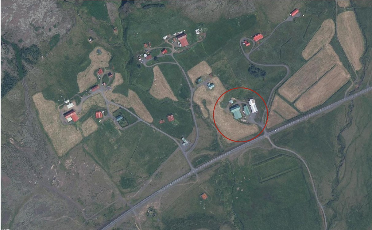
MYND 2. Yfirlitsmynd yfir Hnappavelli 3 . Svæðið sem til stendur að breyta í verslunar og þjónustusvæði er innan rauða hringsins.

Samkvæmt kortlagningu Náttúrufræðistofnunar Íslands á vistgerðum þá er nánast allt skipulagssvæðið L14.2 Tún og akurlendi 4 . Svæðið er ekki á náttúruminjasrá, þar er ekki sérstök vernd náttúrufrýrbæra og er ekki talið mikilvægt fuglasvæði á Íslandi.