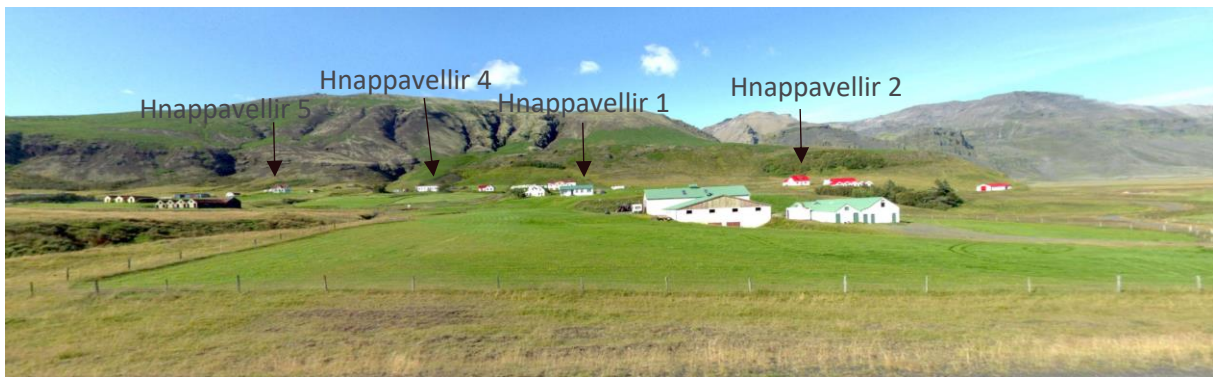
MYND 1. Séð frá Þjóðvegi yfir svæðið 2 . Húsin sem til stendur að breyta eru fremst á myndinni.

Síðastliðin ár hefur verið að byggjast upp ferðaþjónusta á svæðinu og er nýlegt hótél skammt vestan Hnappavalla, enda staðsetning mjög hentug fyrir ferðamenn. Náttúruperlur eins og Skaftafell er skammt frá, jarðfræðileg fjölbreytni m.a. þar sem hopun jökla er auðsjáanleg og stórbrotin saga sveitarinnar dregur að bæði innlenda og erlenda ferðamenn.