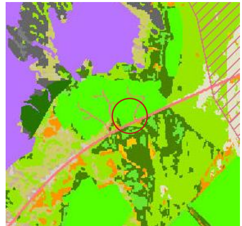
MYND 3. Vistgerðarkort. Svæðið er innan rauða hringsins.

Bæjarlækur rennur skammt vestan við túnið sem umlykur svæðið en hann er ekki talinn mikilvægur fyrir fisk eða vatnalíf.