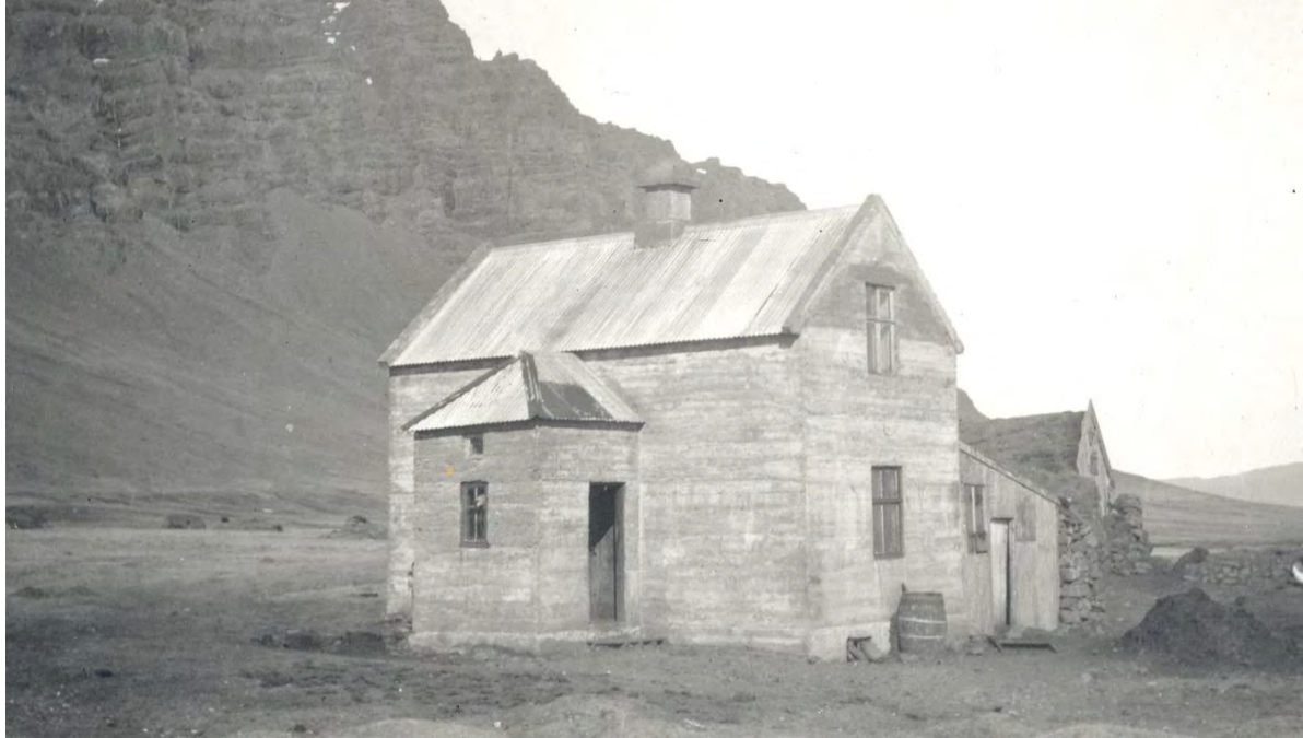
Mynd 8. Breiðabólstaður 1, steinsteypt íbúðarhús reist 1934 á grunni eldri bæjarhúsa.

Árið 1934 var reist steinsteypt íbúðarhús á grunni gamla torfabæjarins frá 1890, 2ja hæða hús með einni burst (mynd 8). Árið 1954 var byggt við það til vesturs.