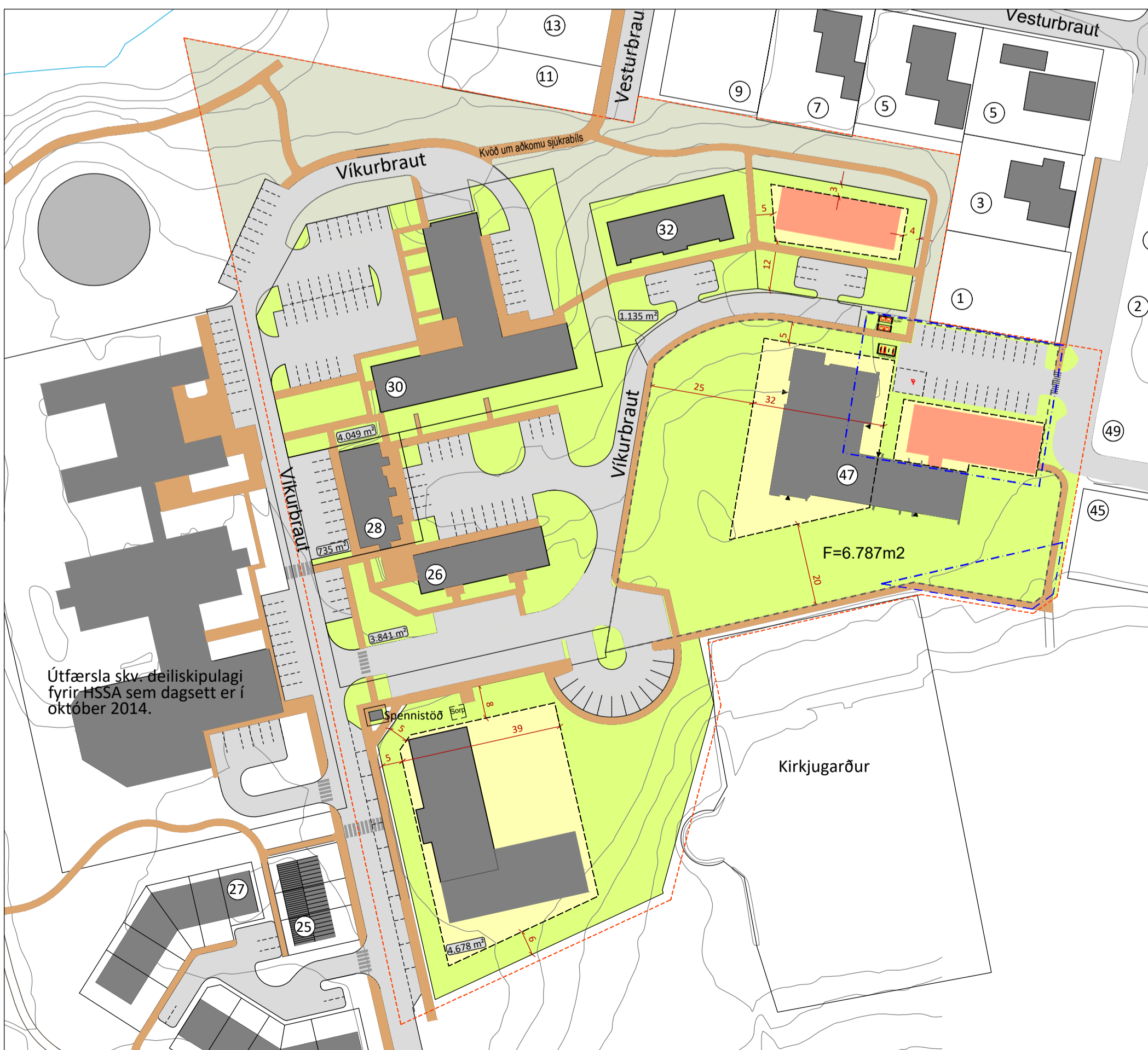
Deiliskipulag, tillaga að breytingu, mkv. 1:1.000