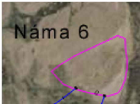
Mynd 3. Deiliskipulagssvæðið.

Svæðið er skilgreint í aðalskipulagi sem efnistökusvæði 35 (E35) og nefnist Náma 6. Umhverfis námuna er landnotkun skilgreind sem skógræktar og landbúnaðarsvæði, rofsvæði. Unnið hefur verið að landgræðslu í Skógey síðan 1984 og er því nú að mestu lokið.