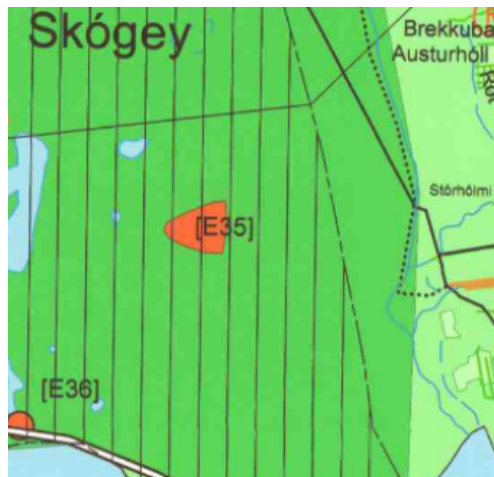
Mynd 2. Efnistökusvæðið Skógey.