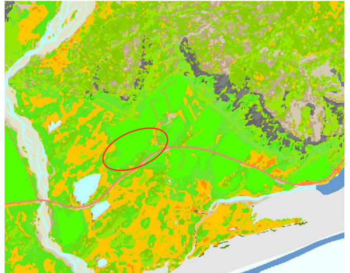
MYND 3. Vistgerðarkort. Svæðið er innan rauða hringsins.

Lækur rennur meðfram aðkomuvegi og er allt landið framræst með skurðum. Í gildi er samningur við Skógræktina (Suðurlandsskóga) frá 2019 um nytjaskógrækt á 17,2 ha svæðis og er fyrirhugað tjaldsvæði umlukið plöntunar- og skógræktarsvæði.