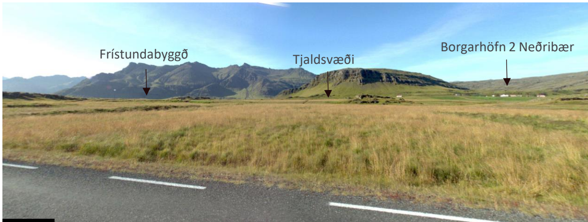
MYND 1. Séð frá Þjóðvegi yfir svæðið 1 .