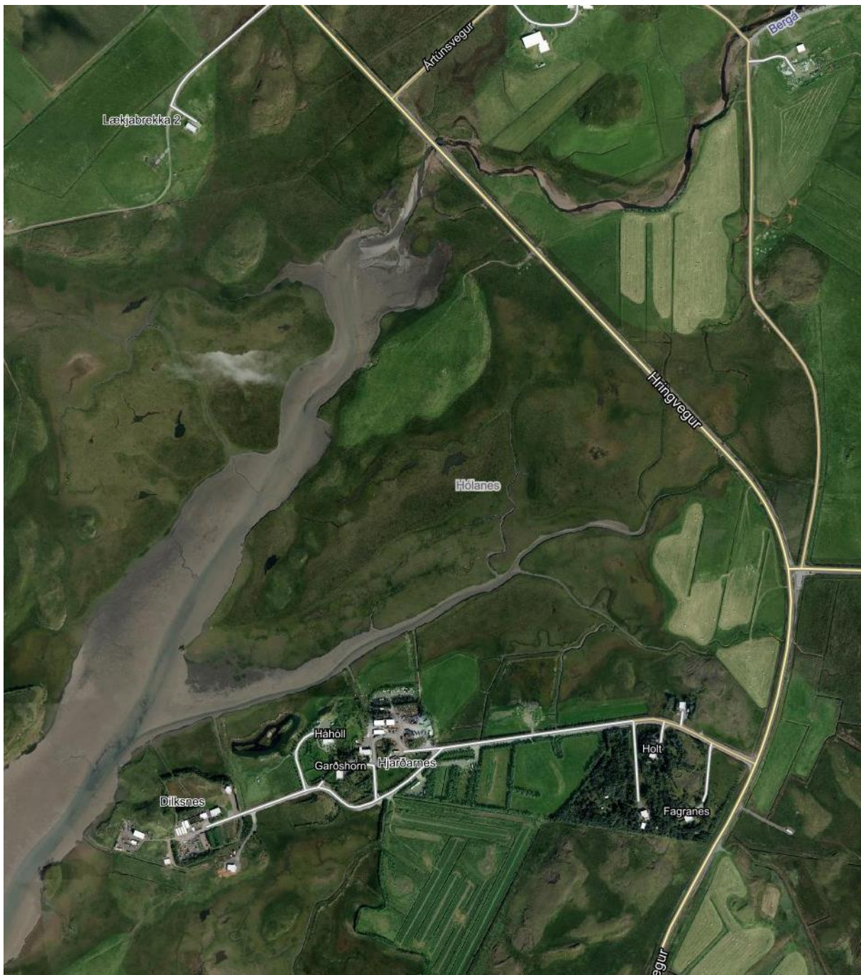
Mynd 2. Loftmynd af Dilksnesi og Háhól/Hjarðarnesi

Á Dilksnesi er nú þegar 2 íbúðarhús ásamt gróðrarstöð, skemmu auk útihúsa sem tengast búrekstri. Þar er gert ráð fyrir að styrkja rekstur gróðrastöðvar og afurðasölu henni tengdri. Þá verður gert ráð fyrir gistingu í húsum fyrir allt að 35 gesti.