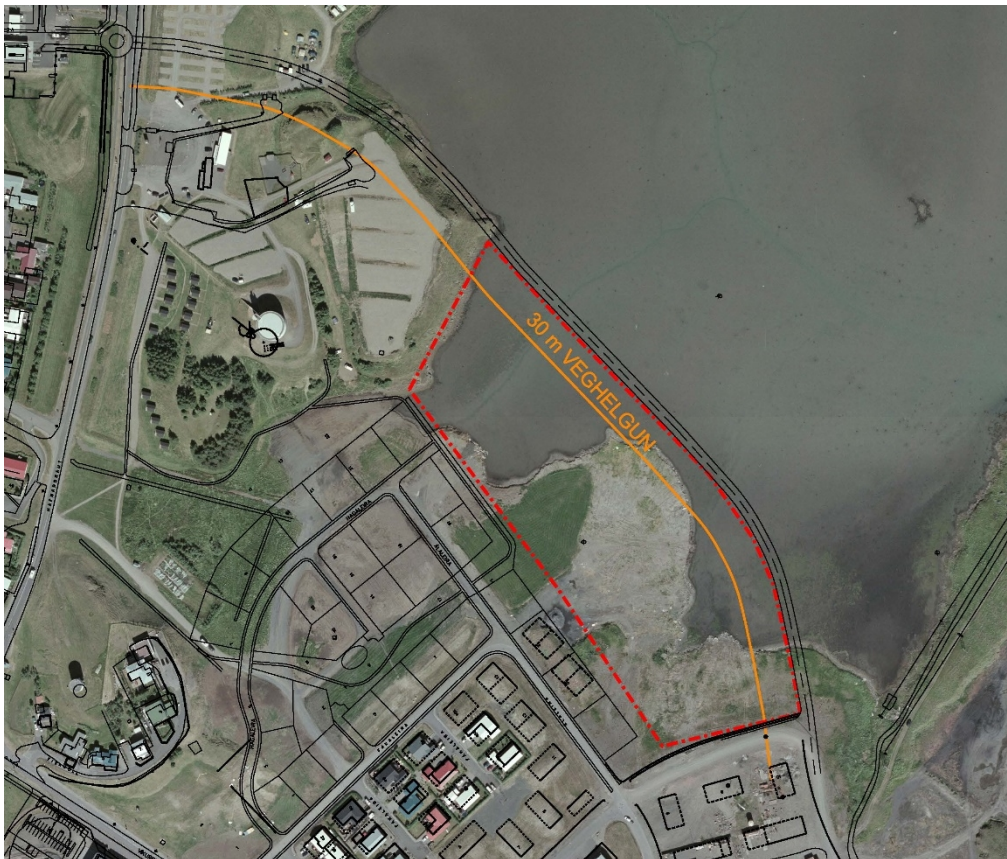
Mynd 1. Deiliskipulagssvæði-loftmynd. Skipulagssvæði markað með rauðri línu.

Skipulagssvæðið er 4 ha og er eignarland sveitafélagsins. Svæðið er á uppfyllingu og er mjög slétt og blautt graslendi. Austan við svæðið liggur hitaveitulögn og þar er áætluð uppbygging nýs þjóðvegjar. Svæðið er í beinum tengslum við núverandi íbúðabyggð og stutt þjónustu og atvinnusvæði.