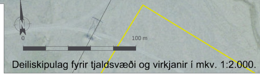
Deiliskipulag fyrir tjaldsvæði og virkjanir í mkv. 1:2.000.

Deiliskipulagstillagan öðlast gildi með auglýsingu í B-deild Stjórnartíðinda _____