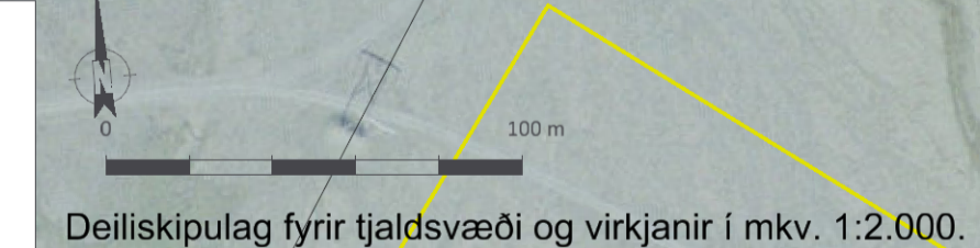
Deiliskipulag fyrir tjaldsvæði og virkjanir í mkv. 1:2.000.

Deiliskipulagstillagan öðlast gildi með auglýsingu í B-deild Stjórnartíðinda _____