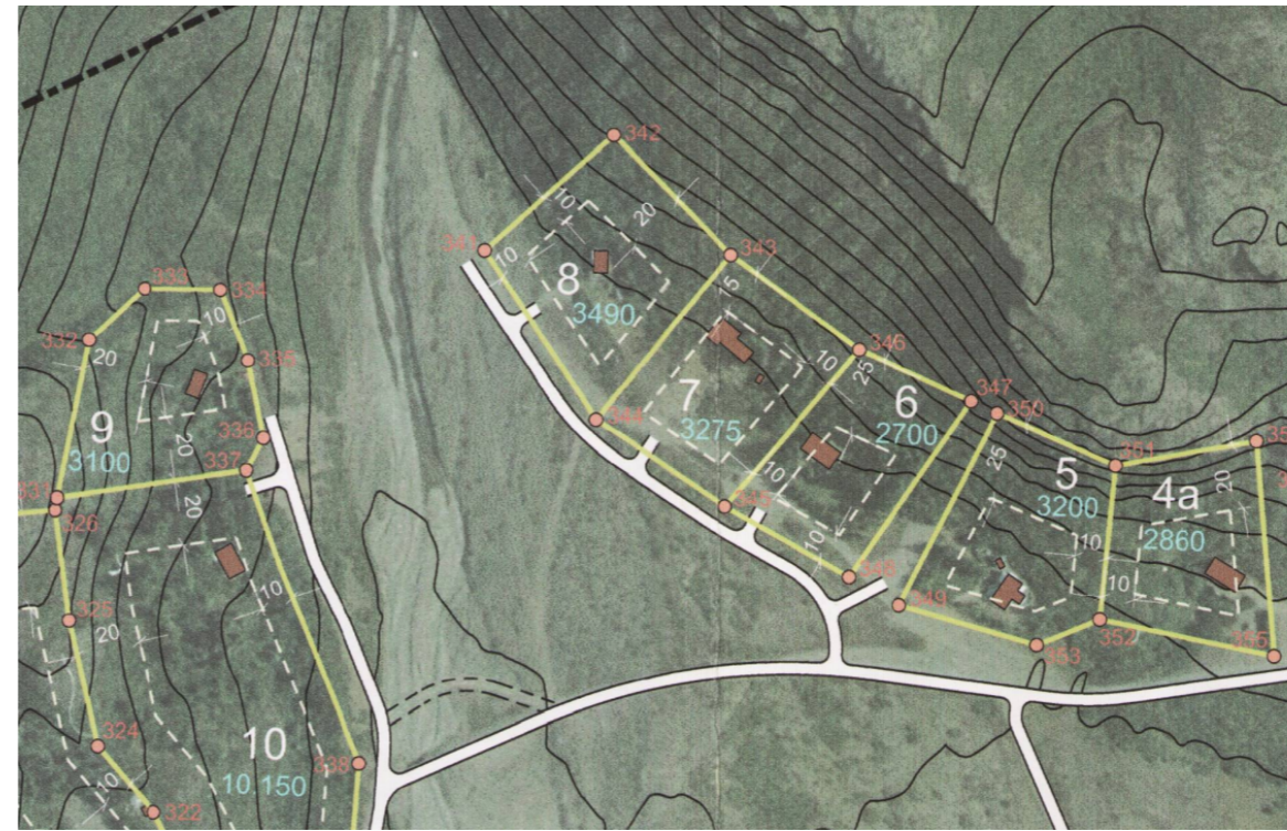
Yfirlitsmynd í gildandi deiliskipulagi. Engar breytingar eru á uppdráttum.