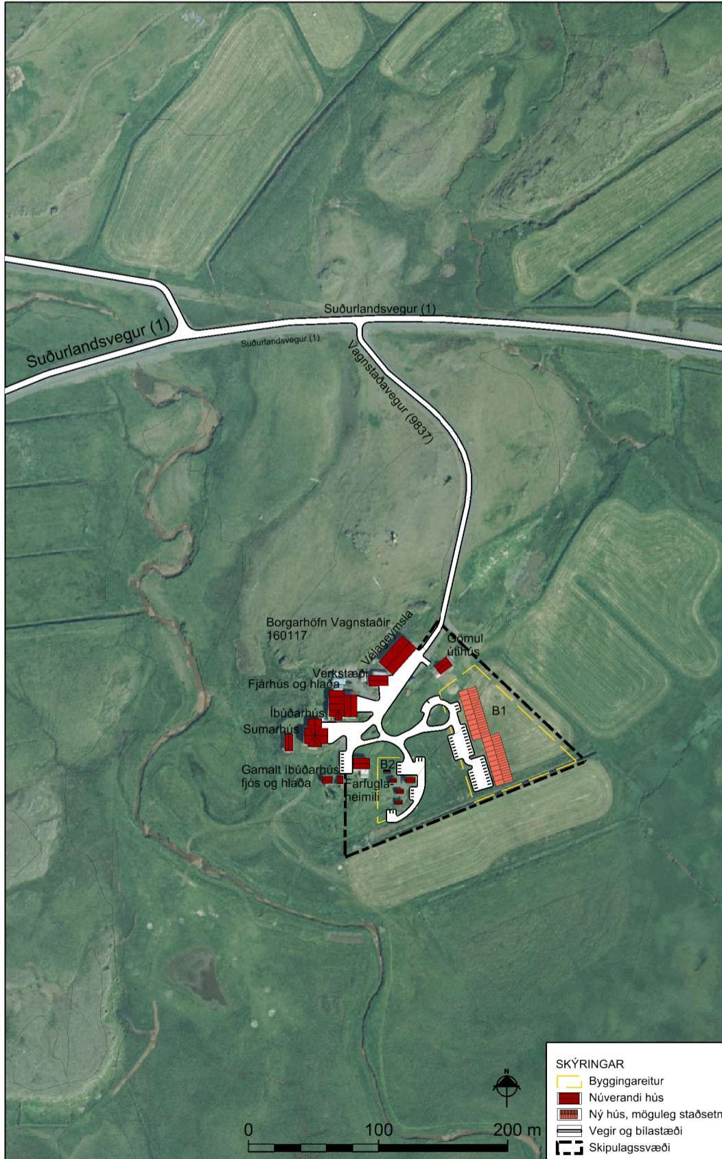
Skýringaruppráttur í mkv 1:4.000